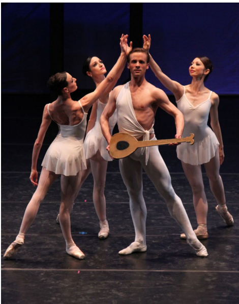
▲ 英国皇家芭蕾舞团在沪演出