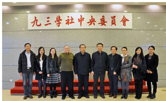
▲《社会科学报》社成员与九三学社中央委员会领导合影